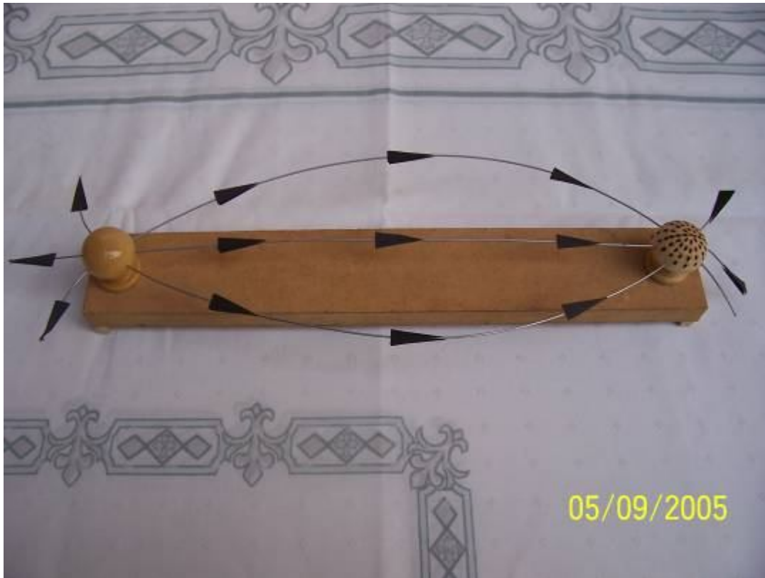
Foto 6: Maquete tátil-visual de representação de cargas elétricas positiva e negativa e a interação entre suas linhas de força.