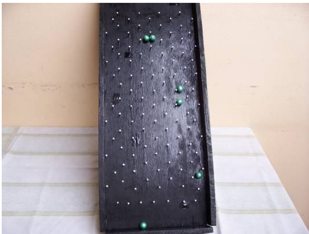
Foto 4: maquete tátil-visual-auditiva analógica: corrente elétrica, ddp, resistividade elétrica

Atendimentos particularizados, observados em episódios que previam tal prática junto a todos os alunos, não foram considerados ambientes segregativos de ensino. Isto implica dizer que a posição adotada não é contrária a realização de atendimentos particularizados para quaisquer alunos, e sim, a aqueles que representam exclusão em relação ao tratamento educacional da aula ministrada.