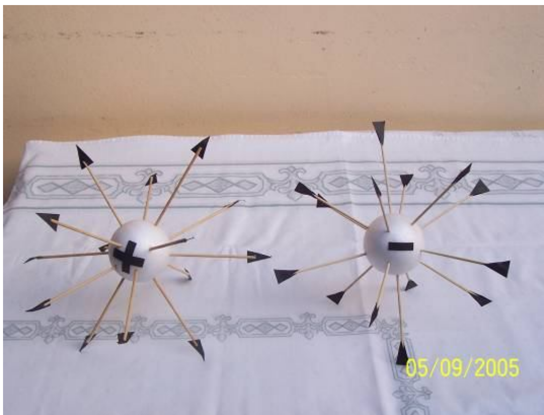
Foto 5: Registro tridimensional de representação de cargas elétricas positiva e negativa e suas respectivas linhas de força.

Cinco foram as maquetes utilizadas: (a) registro tridimensional de cargas elétricas positiva e negativa e suas respectivas linhas de força (foto 5); (b) maquete tátil-visual de cargas elétricas positiva e negativa e a interação entre suas linhas de força (foto 6); (c) maquete tátil-visual de rede cristalina cúbica. (foto 7); (d) maquete analógica tátil-visual de condutor elétrico (comprimento do condutor, área do condutor e resistividade do condutor) - segunda Lei de Ohm- (foto 8); (e) maquete tátil-áudio-visual analógica (corrente elétrica, diferença de potencial, resistência elétrica e resistividade elétrica - foto ).